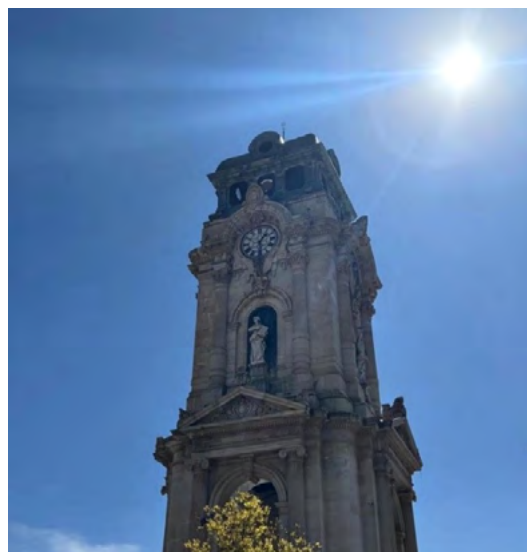
Figura 1. Reloj Monumental de Pachuca como hito urbano central y principal referente simbólico del centro histórico, con limitada integración funcional al espacio peatonal circundante (fotografía de campo, 2024).

espacio público y la transformación del centro en un espacio predominantemente de tránsito. El Reloj Monumental constituye el principal hito urbano y referente simbólico del centro histórico; sin embargo, su entorno inmediato presenta una integración limitada con las dinámicas cotidianas del espacio público (Figura 1).