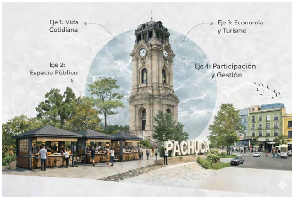
Figura 5. Esquema conceptual de revitalización del entorno del Reloj Monumental de Pachuca, basado en los cuatro ejes estratégicos: vida cotidiana, espacio público, reactivación económica y participación ciudadana (elaboración propia).

Figure 5. Conceptual scheme for the revitalization of the surroundings of Pachuca's Monumental Clock, based on four strategic axes: everyday life, public space, economic reactivation, and citizen participation (author's own elaboration).