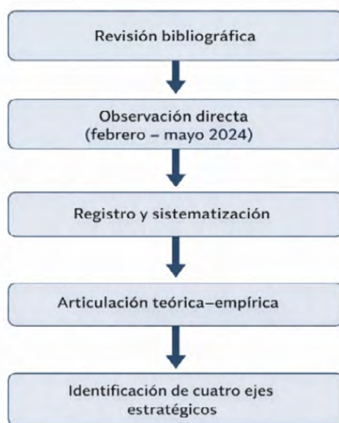
Figura 2. Diagrama metodológico del proceso de investigación (elaboración propia).

El estudio privilegia un análisis cualitativo de carácter interpretativo, por lo que sus resultados no buscan generalización estadística, sino una comprensión profunda del caso de estudio. No obstante, la duración del trabajo de campo permitió fortalecer la validez interna de los hallazgos. El proceso metodológico se sintetiza en el siguiente esquema (Figura 2).