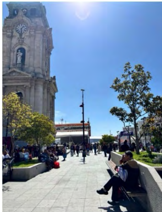
Figura 3. Plaza Independencia. Uso intensivo del espacio público, con presencia simultánea de tránsito y permanencia en horario diurno, que evidencia procesos de apropiación social del entorno (fotografía de campo, 2024).

Desde la perspectiva de Jane Jacobs, la vitalidad urbana depende en gran medida de la presencia constante de personas en