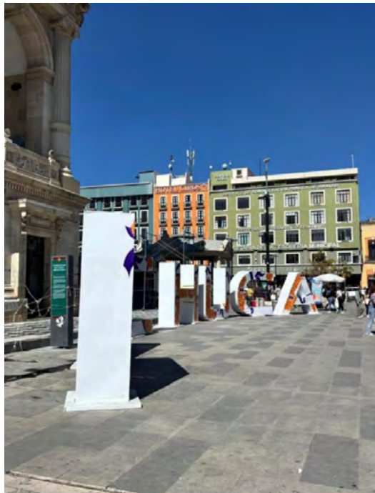
Figura 4. Plaza Independencia. Instalación urbana con fines turísticos y de identidad visual “Pachuca”, como estrategia de activación simbólica del espacio público y atracción de visitantes (fotografía de campo, 2024).

El análisis del Centro Histórico de Pachuca permite reconocer una disminución progresiva de la actividad económica tradicional, caracterizada por el cierre de comercios históricos, el aumento de locales desocupados y la sustitución de usos mixtos por actividades de bajo valor agregado. En diversos tramos de la calle Guerrero y la calle Venustiano Carranza se advierte una alta rotación comercial, así como la presencia de inmuebles subutilizados o parcialmente abandonados. De manera complementaria, se identifican intervenciones urbanas orientadas a fortalecer la imagen turística del centro histórico, como la instalación de elementos simbólicos en espacios públicos estratégicos, que buscan atraer visitantes y dinamizar la actividad económica local (Figura 4).