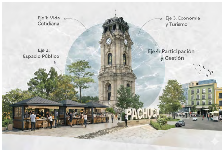
Figura 5. Esquema conceptual de revitalización del entorno del Reloj Monumental de Pachuca, basado en los cuatro ejes estratégicos: vida cotidiana, espacio público, reactivación económica y participación ciudadana (elaboración propia).

Figure 5. Conceptual scheme for the revitalization of the surroundings of Pachuca's Monumental Clock, based on four strategic axes: everyday life, public space, economic reactivation, and citizen participation (author's own elaboration).